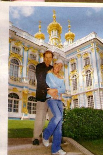
Das Paar auf den Stufen zum Katharinenpalast, in dem sich das berühmte „Bernsteinzimmer“ befindet