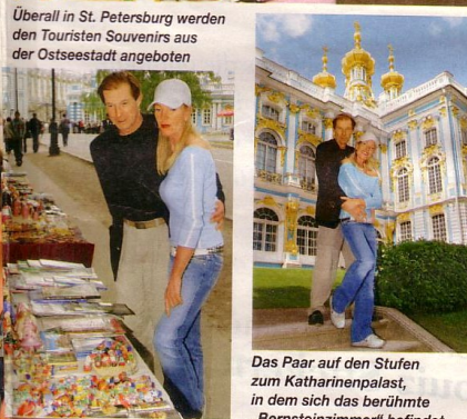
Überall in St. Petersburg werden den Touristen Souvenirs aus der Ostseestadt angeboten